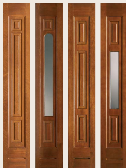
Boční světlík č. 1